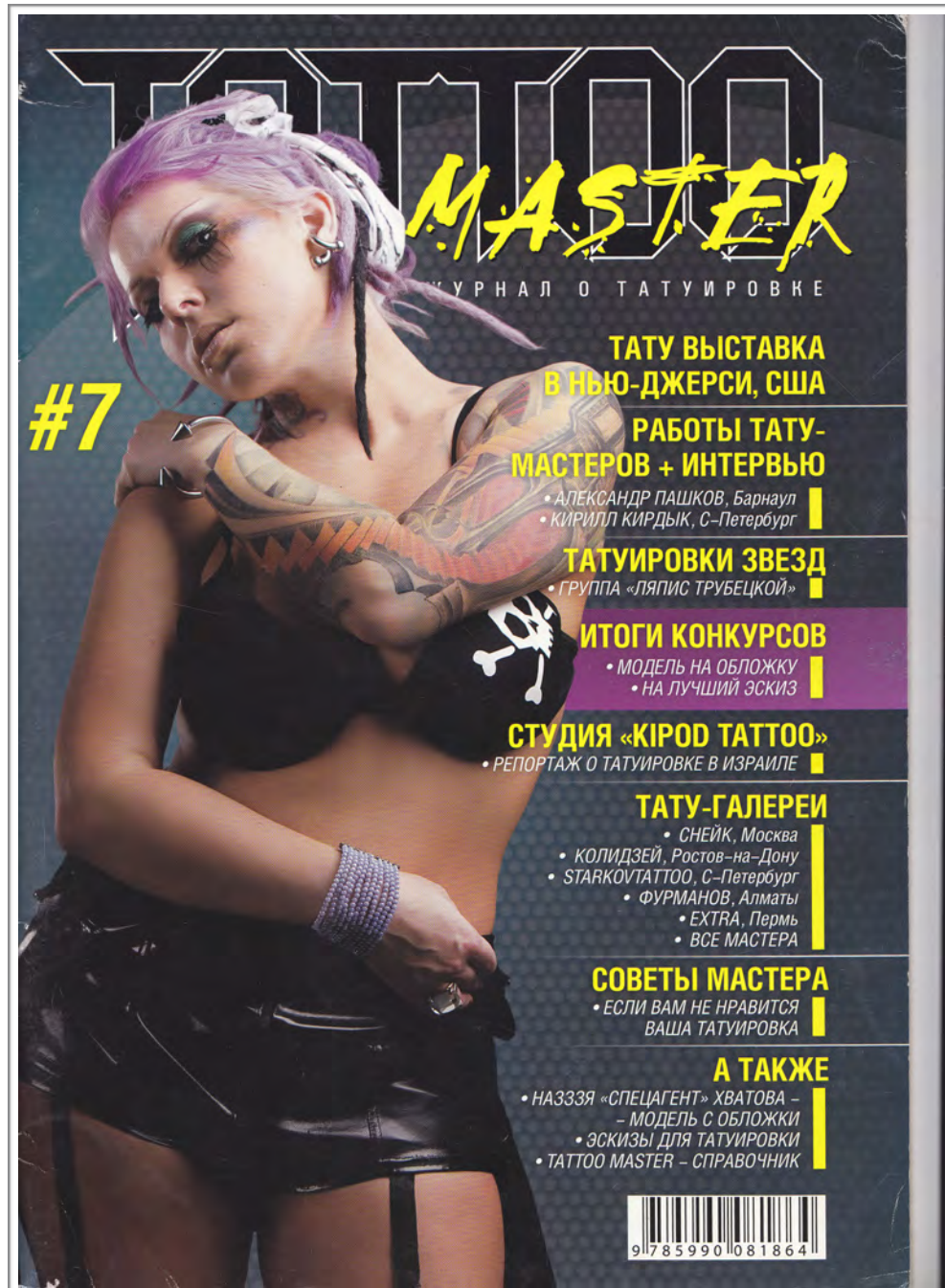
Tattoo Master Magazine # 7. Russia. Educational article by Sergey "George" Bardadim